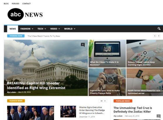
ABC News weboldalának utázmata.

17. Mindig ellenőrizzük, hogy egy weboldal vagy Twitter-fiók valóban az, aminek mondja magát! A manipulatív tartalmak gyakran jelennek meg a főáramú, ismert médiumok weboldalaira hajazó oldalakon. Minden esetben ellenőrizzük le, hogy azon a weboldalon járunk-e, amelyiken gondoljuk. Ha beírjuk a kérdéses weboldal nevét a keresőbe, valószínűleg az eredeti verzió ugrik majd fel első találatként.