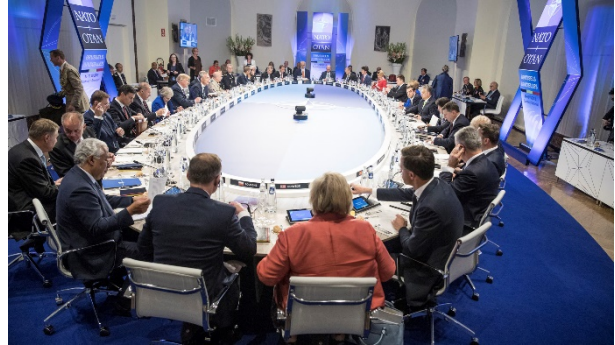
(A NATO állam- és kormányfőinek ülése.)